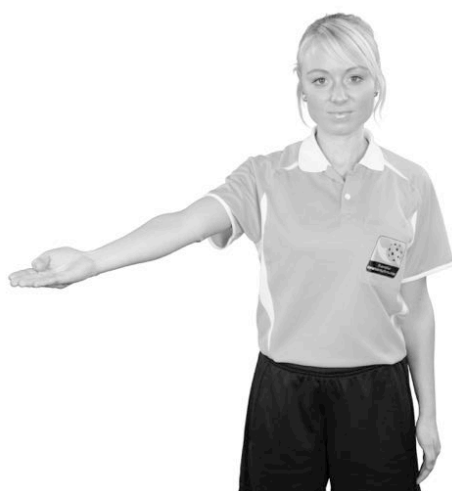
805 Fördel (armen i fördelsriktningen, handflatan snett uppåt in mot planen)