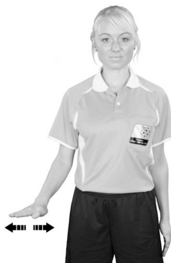
919 Liggande spel (handflatan nedåt)