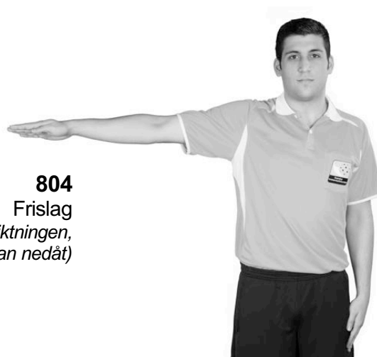
804 Frislag (armen vågrätt i fördelsriktningen, handflatan nedåt)