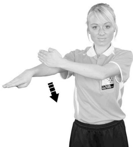
902 Låsning av klubba (handflatan nedåt)