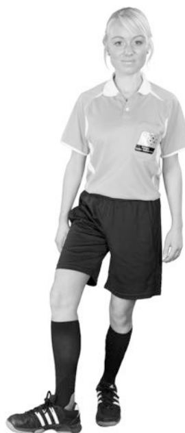
912 Otillåten spark (foten i vrishöjd, vriden utåt)