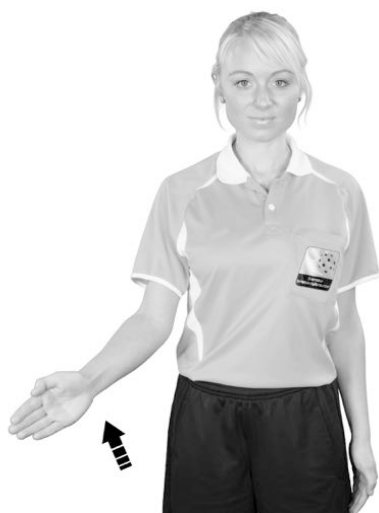
920 Hands (handflatan snett uppåt)