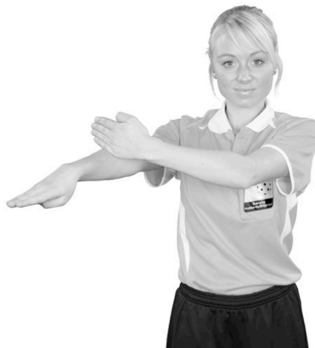
901 Otillåtet slag (ett slag med handen)